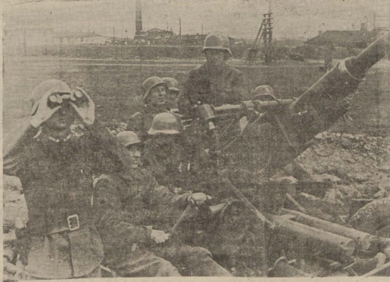
Şark cephesinde muharebelere iştirak eden Macar ağır topçuları faaliyette

Moskova, Voronej bölgesinde birçok meskûn mahallerin tekrar işgal edildiğini bildiriyor