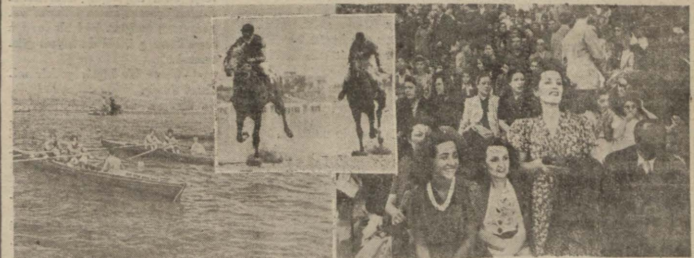
Dünkü at yarışlarından ve kürek müsabakalarından görünüşte

Dün Ankarada yapılan bölgeler arası Türkiye atletizm birinciliği müsabakalarında Ankara birinci, İstanbul ikinci oldu, Başvekil müsabakaları sonuna kadar takip etti