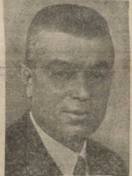
Doktor Behçet Uz

Vekil Millî Şefe Adanalıların saygılarını ib'âğ etti