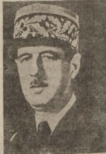
General De Gau (Yazısı 5 inci sayfada)

Liyonda halk: "Yaşasın Dögol, kahro şun Laval!,, diye bağırıldı